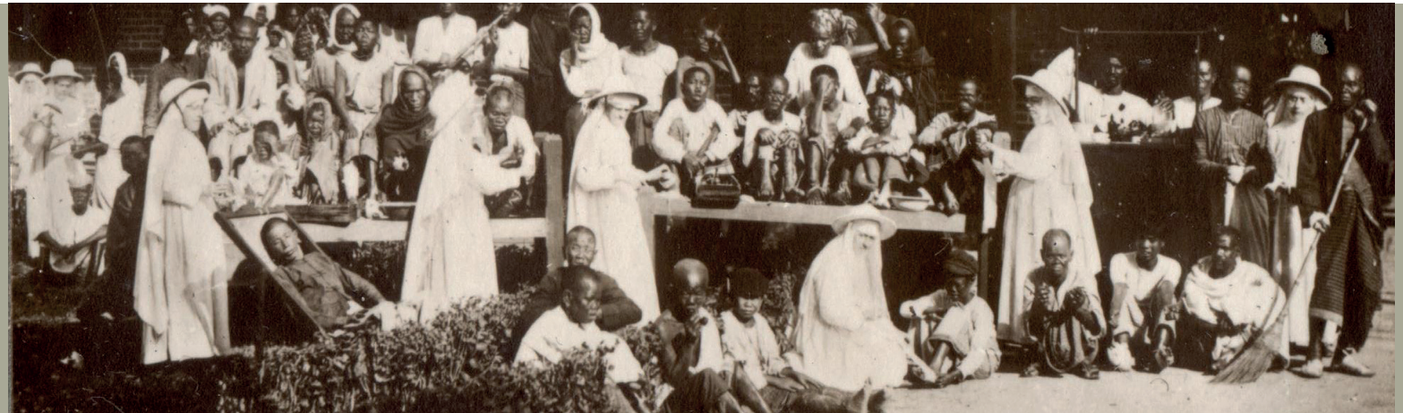
Dispensaire au Congo